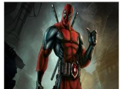
Wade dans son costume de Deadpool

Deadpool possède un facteur de guérison (comme Wolverine) qui lui permet de guérir de blessures par balles ou de brûlures en quelques instants. Il a une force et une agilité hors du commun et il est très à l'aise avec les sabres, pistolets et armes de jet.