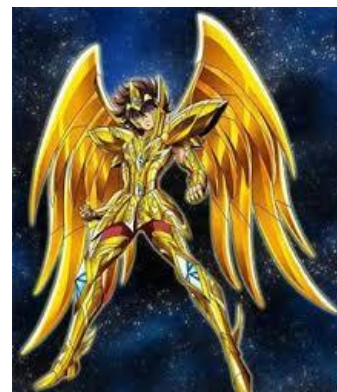
Seiya le personnage principal

Ces 88 chevaliers sont classés par différents rangs : Bronze Argent Or 12 or 28 argent et 48 bronze