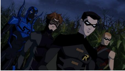
Tim avec Kid flash, Red Arrow, Blue Beetle.

Tim Drake devient le 3ème Robin en découvrant la double vie de Bruce Wayne. Celui-ci lui avait déconseillé mais Tim prit quand même le costume de Robin délaissé par Dick Grayson et Jason Todd. En observant les capacités de Tim, Batman fait de lui le 3ème Robin.