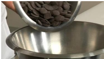
Chocolat cuit au bain marie

Faire fondre le beurre. Mélanger le beurre, 4 jaunes d'œufs et le sucre ensemble. Bien mélanger pour obtenir une pâte uniforme. Ajouter petit à petit la farine et la levure tout en ajoutant de temps en temps une cuillère à soupe de lait mais pas plus de 6. Battre les blancs d'œufs en neige et les incorporer à la pâte. Ajouter une cuillère à soupe d'extraits de vanille et une cuillère à soupe de rhum. Mettre dans un récipient séparé 250 g de la pâte. Y ajouter 25 g de chocolat en poudre et une grosse cuillère à soupe de pâte à tartiner au chocolat. Ajouter les 2 cuillères à soupe de lait restant pour que le chocolat soit moelleux et une dernière cuillère à soupe de vanille. Beurrer et fariner le moule. Verser une des deux parties de la pâte dans le moule. Mettre au four pendant 20 min. Vérifier au bout de 20 min la cuisson du gâteau en plantant un couteau car en fonction des fours il cuit plus vite. Mettre la deuxième pâte dans le moule. Mettre au four pendant 20 min. Vérifier au bout de 20 min la cuisson du gâteau en plantant un couteau. Découper toute la partie gonflée (ronde du cake) et couper le reste du cake en 4 (ou plus si vous voulez qu'il y ait plus d'alternance de couleurs). Ensuite, coller les morceaux entre eux avec la pâte à tartiner (ou chocolat cuit au bain marie) mais il ne faut pas que deux mêmes couleurs se touchent.