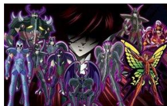
Hades et quelques spectres

Poséidon s'est réincarné en Julian Solo (riche industriel) et 7 généraux ont été choisis dans les Marinas Poséidon.