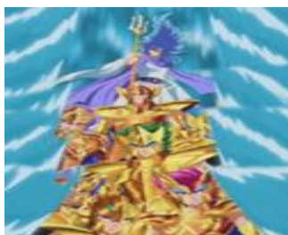
Poséidon et les 7 généraux