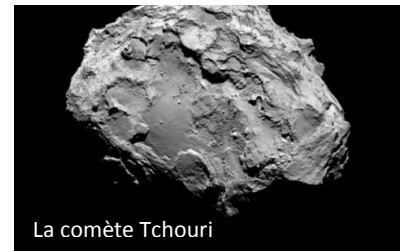
La comète Tchouri